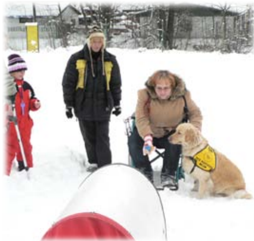
Lov vánočního krocana

Psovod sedí na invalidním vozíčku a drží psa za obojek – bez vodítka, nesmí překročit (přejet) startovní čáru – tyčku na zemi, na pokyn startéra odhodí buřta na vzdálenost minimálně 2 metry a podle svého uvážení (možno ihned) vypouští psa s povelům pro přinesení aportu – buřta zpět. Vyhrává pes, který přinese celého buřta a neporušeného buřta předá psovodovi.