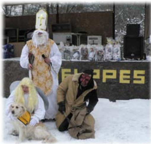
Svatá trojice a Kačenka