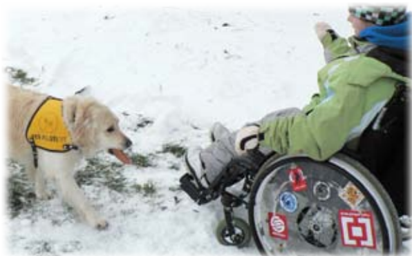
Aport čertova kopýtka – aneb aportování buřta. Vyhrává pes, který přinese celého buřta a neporušeného buřta předá psovodovi.