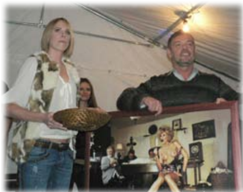
Licitátor dražby fotografie dokázal přítomně vyhecovat na neuvěřitelných 176 000 Kč