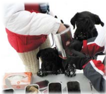
Pekelné menu – chleba, psi pamlsek Frolík, černá oliva, okurka a fazole