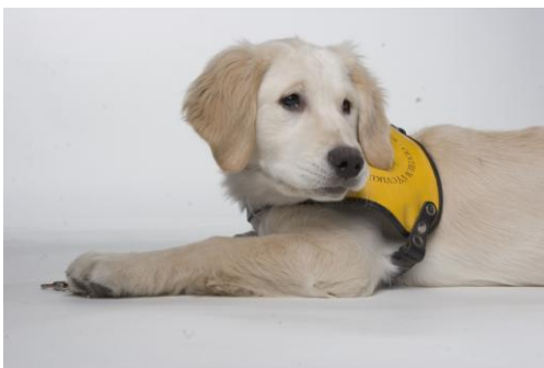
a to je naše Fazole